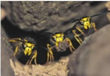
Wespen ( Vespula sp. )

woordigers van deze orde heeft bijtende of stekende monddelen, waarmee wij als mens onaangenaam in contact kunnen komen. Ook hier zijn het enkel de vrouwtjes die steken. Spinnen zijn geen insecten, ze behoren tot de orde van de Araneae. Giftige spinnen komen in België normaal gezien niet voor, maar een aantal van onze inlandse soorten kan voor vervelende beten zorgen.