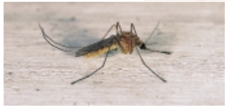
Mug ( Culex sp.)

Waar je ook bent, deze insecten vind je overal. In de tropen brengen ze vaak gevaarlijke ziektes over, zoals slaapziekte en malaria. De soorten die bij ons voorkomen, zorgen alleen maar voor slapeloze nachten en jeuk.