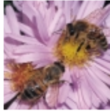
Honingbij ( Apis mellifera )

Honingbijen zijn niet agressief, maar zullen steken als ze zich bedreigd voelen. Dit betekent meteen ook het einde van hun leven. Aangezien de angel van een bij met weerhaakjes bezet is, blijft deze steken in de huid van het slachtoffer. Als de bij zich probeert los te trekken scheurt hij de angel met de gifblaas los van zijn achterlijf. Die blijft dan achter in de huid. Aangezien de gifblaas tot een minuut na de steek kan blijven doorgaan met het pompen van gif, moet men de angel zo snel mogelijk verwijderen.